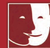
Personne en situation de handicap mental