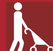
Personne avec enfant en poussette