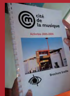
La Cité de la musique édite des brochures adaptées pour les personnes aveugles ou malvoyantes.