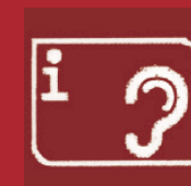
Information pour les personnes malentendantes