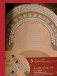
Plan de salle du théâtre de Morlaix.