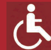
Personne handicapée motrice