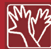
Langue des signes