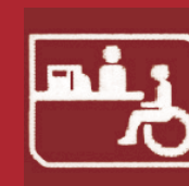
Caisse/comptoir accessible aux personnes handicapées motrice