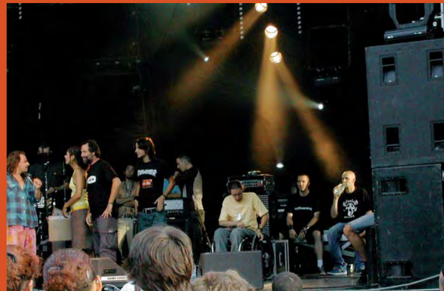
Le festival Ultrasons en plein air à Marolles-en-Brie (Seine-et-Marne).

L'AGEFIPH (Association de gestion du fonds pour l'insertion des personnes handicapées) et le FIPHFP (Fonds pour l'insertion des personnes handicapées dans la fonction publique) peuvent apporter leur soutien financier pour les dépenses supplémentaires des artistes professionnels en situation de handicap (appelées « besoins en compensation » dans la loi de 2005).