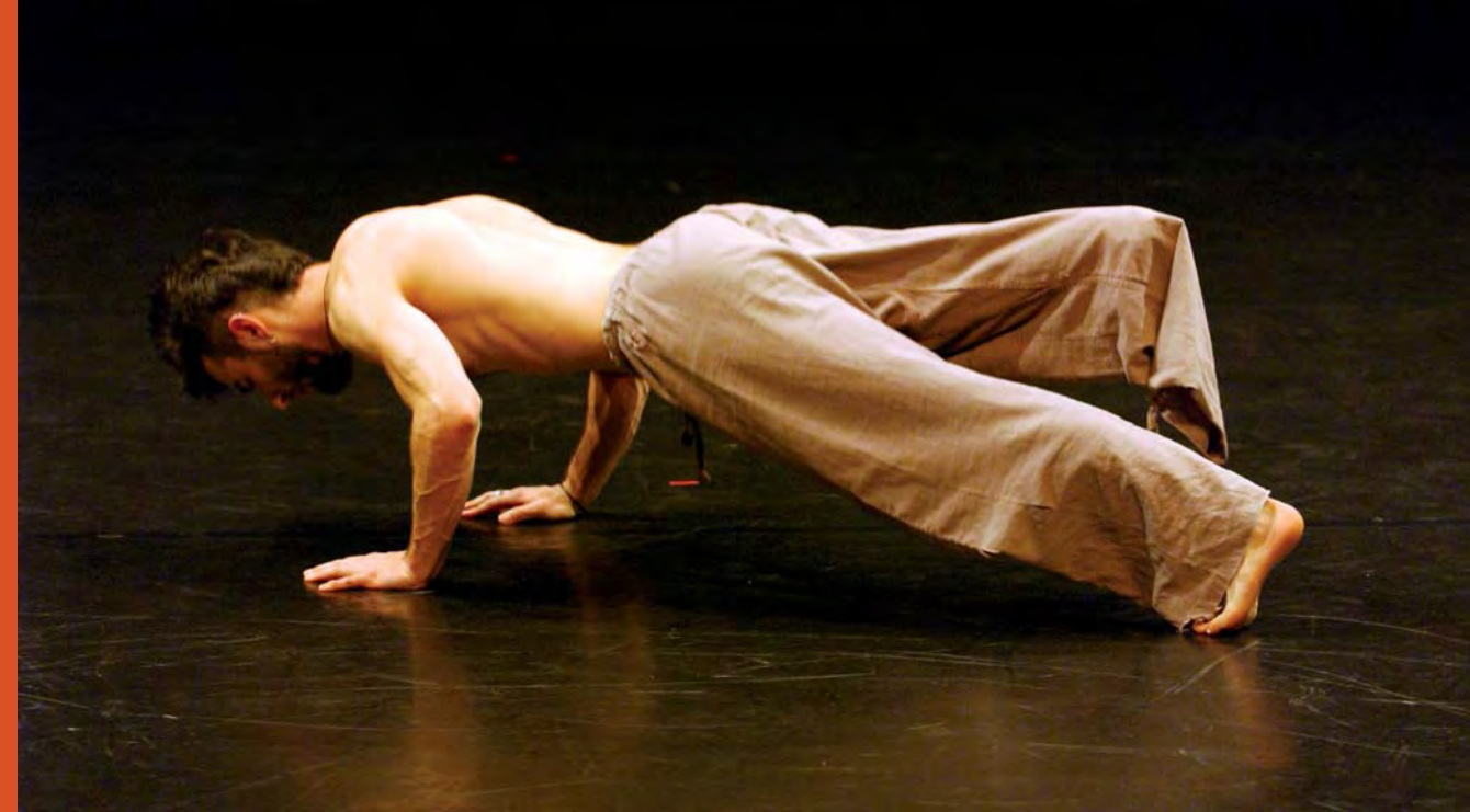
Différents duos différents par la compagnie Ouffi au théâtre Golovine, en 2008.

Scène nationale de Petit-Quevilly/Mont-Saint-Aignan par Ludovic Moreau