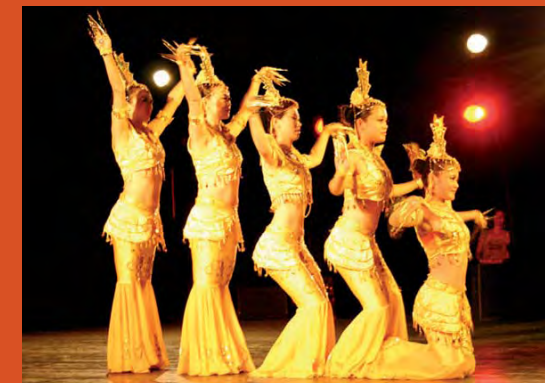
My Brothers and Sisters Performing Art Troupe, 8 danseurs de Jinang (Chine), et Russian Soul, troupe russe d'une dizaine de danseurs sourds, au théâtre Silvia-Monfort lors du Festival du silence 2006 à Paris organisé par ChanDanse des Sourds.